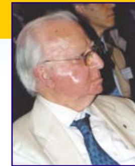
di Alfonso Forte

Una frase, questa che caratterizzò tutta una vita; quella di un grande personaggio vissuto a cavallo tra XVIII e XIX secolo, scrittore, pensatore estroso e irrequieto. Vittorio Alfieri.